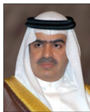
الشيخ فوز بن محمد آل خليفة