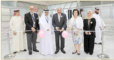
رئيس الجامعة وعلى يساره عميدة كلية العلوم الصحية (رشيفية)

(غير مكتمل)، ويتقدم لامتحان نهائي في المقرر يتم عقده خلال جدول زمني تغلته الجامعة ليكون في الأسبوع الأول من الفصل الأول بالعام الدراسي المقبل. وبحسب الجامعة فإن النتيجة النهائية المقرر مستحسب ضمن المعدل التراكمي في حال اختيار المسار الثاني كما هو متبع في الفصول الأخرى، ويخصص 60% من الدرجة النهائية لمن يختار هذا المسار، وتخصص نسبة 40% لامتحان النهائي، وتحسب الدرجة أو التقدير النهائي من المجموع الكلي كما هو متبع في باقي الفصول.