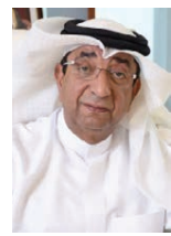
○ سفير ناس.

بعد المباركة الملكية سامية من حضرة صاحب الجلالة الملك حمد بن عيسى آل خليفة عاهل البلاد المفدى، واستناداً إلى رأي المجلس الأعلى للشؤون الإسلامية في جلسته الاعتيادية الرابعة المنعقدة بتاريخ ٢٦ شعبان ١٤٤١هـ الموافق ١٩ أبريل ٢٠٢٠م، بالموافقة