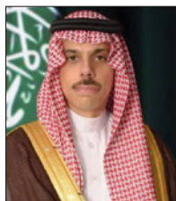
وزير الخارجية السعودي

وقال سموه إن البحرين تشهد اليوم صورًا نبيلة من حب الوطن عبر ما يقوم به أبناءها العاملون في القطاع الصحي من جهود كبيرة على مدار الساعة، وهي جهود مبدرة من قبل الجميع، يدعمهم فيها بكل عزيمة أبناء البحرين من مختلف القطاعات والمجالات بروح فريق