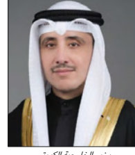
وزير الخارجية الكويتي

وجرى خلال الاتصال بحث التعاون المشترك لمواجهة تداعيات انتشار فيروس كورونا في دول المنطقة، والمسائل المتعلقة بمسيرة العمل الخليجي المشترك.