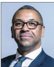
وزير شؤون الشرق الأوسط البريطاني

واستعرض السفير تجربة البحرين الرائدة في المنطقة والعالم في مكافحة انتشار فيروس كورونا، والتي أشادت بها منظمة الصحة العالمية والعديد من الدول، وذلك من خلال معدلات الشفاء العالية لتعزير التعاون القائم في مجالات الاقتصاد بما يخدم الأهداف الموضوعية ويحقق تطلعاتهم بمضاعفة حجم التبادل التجاري القائم والسعي نحو تشجيع السياحة والاستثمار المشترك، والتشاور لعقد اجتماع مجموعة العمل المشتركة بين البلدين المقبل على ملكة البحرين خلال العام الحالي.