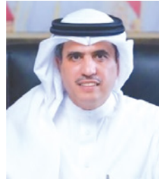
وزير شؤون الإعلام

أشاد وزير شؤون الإعلام، علي بن محمد الرميحي، بالمستوى الرفيع الذي وصل إليه الإعلام البحريني من مهنية واحترافية عالية، وبالجهد الكبير الذي يبذله الكوار الإعلامية في مختلف المؤسسات الوطنية، وما تقدمه من متابعة وتحليل للقضايا الوطنية، لرفع وعي المجتمع، وإبراز المكتسبات الوطنية المشرفة، والدفاع عن قضايا الأمة في مختلف المحافل. جاء ذلك في رسالة شكر وتقدير للكوار الإعلامية في مملكة البحرين، بمناسبة الاحتفال بيوم الإعلام العربي، والذي يصادف الحادي والعشرين من أبريل من كل عام، والذي تبناه مجلس وزراء الإعلام العرب في الدورة العادية السادسة والأربعين عام 2015، حيث أكد الرميحي أن اختيار «كالات الأنباء العربية» موضوعاً للدورة الخامسة لهذه الاحتفالية، يأتي اعترافاً