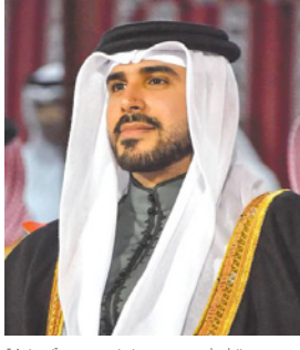
سمو الشيخ محمد بن سلمان بن حمد آل خليفة